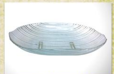
UD2660L Mod. Tropical Oval Fruteira, saladeira, travessa grande p/ doces e assados 390mm (comp.) x 305mm (larg.) x 66mm (alt.)