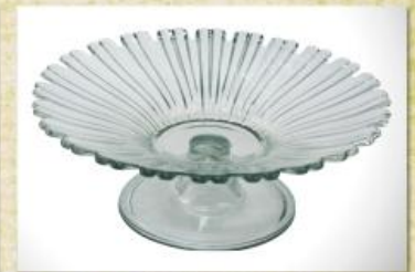
UD2563L Mod. Madri c/ pedestal Fruteira, saladeira, centro de mesa 340mm (diam.) x 130mm (alt.)