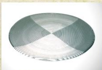
UD2658L Mod. Frisado Prato para bolo, tortas, canapés, frios, aperitivos, carnes e outros 300mm (diam.) x 18mm (alt.)