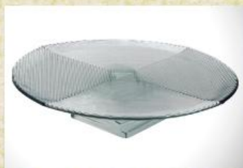
UD2664L Mod. Big Frisado c/ ped. pirâmide Prato grande para bolo, tortas, canapés, frios, aperitivos, carnes e outros 390mm (diam.) x 85mm (alt.)