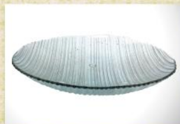
UD2659L Mod. Tropical Big Fruteira, saladeira, centro de mesa, tigela grande rasa p/ doces e massas 380mm (diam.) x 80mm (alt.)