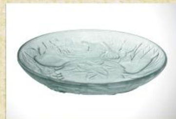
UD2546L Prato fundo mod. decorado Prato fundo p/ queijos, sopas, cereais, petiscos e sobremesas 190mm (diam.) x 32mm (alt.)