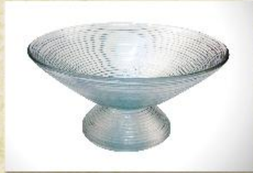
UD2260L Mod. Coliseu média c/ pedestal Fruteira, saladeira, centro de mesa, tigela p/ doces, massas e gelatina 250mm (diam.) x 120mm (alt.)