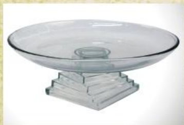
UD2504L Mod. liso c/ pedestal pirâmide Prato para bolo, pudim, tortas, doces, frios, assados e aperitivos 309mm (diam.) x 110mm (alt.)