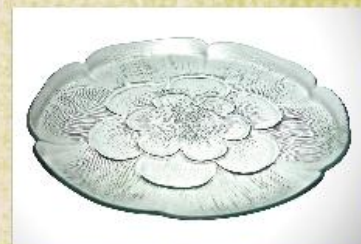
UD2338L Mod. Garden Prato para bolo, pudim, tortas, doces, frios, assados e aperitivos 315mm (diam.) x 35mm (alt.)