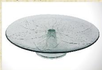
UD2526L Mod. Granfolha reto c/ pedestal Prato para bolo, tortas, canapés, frios, aperitivos, carnes e outros 380mm (diam.) x 108mm (alt.)