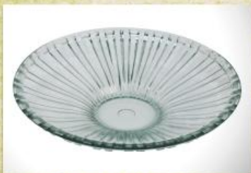
UD2559L Mod. Barcelona Fruteira, saladeira, centro de mesa 370mm (diam.) x 75mm (alt.)