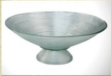
UD2249L Mod. Coliseu grande c/ pedestal Fruteira, saladeira, centro de mesa 350mm (diam.) x 135mm (alt.)