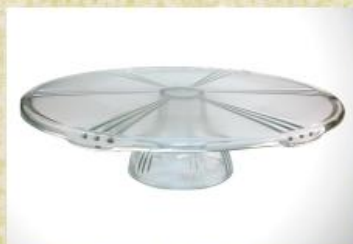
UD2676L Mod. Lion c/ pedestal Prato para bolo, tortas, canapés, frios, aperitivos, carnes e outros 320mm (diam.) x 85mm (alt.)