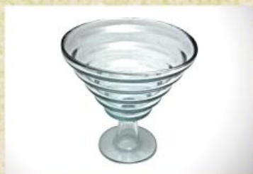
UD2301L Mod. Degraus média c/ pedestal Fruteira, champanheira, centro de mesa 245mm (diam.) x 250mm (alt.)