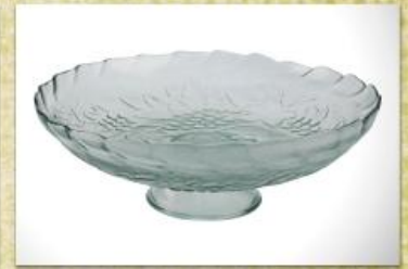
UD2516L Mod. Veneza c/ pedestal Fruteira, saladeira, centro de mesa, tigela p/ doces 335mm (diam.) x 130mm (alt.)