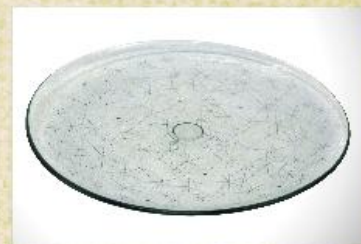
UD2280L Prato/Sousplat mod. decorado Descanso p/ pratos, tigelas e travessas, prato para bolo, tortas, frios e assados 300mm (diam.) x 20mm (alt.)