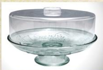
UD2235L Mod. decorado c/ ped. e cúpula Prato para bolo, pudim, tortas, doces, frios e assados c/ tampa plástica 309mm (diam.) x 185mm (alt.)