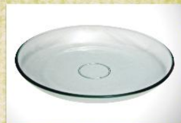
UD2014L Mod. liso Prato para bolo, pudim, tortas, doces, frios, assados e aperitivos 309mm (diam.) x 42mm (alt.)