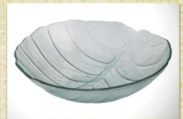
UD2530L Mod. Folha Fruteira, saladeira, tigela p/ doces, massas e gelatina 320mm (diam.) x 95mm (alt.)