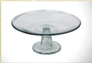
UD2508L Mod. liso c/ pedestal longo Fruteira, centro de mesa, taça rasa p/ doces e aperitivos 205mm (diam.) x 92mm (alt.)