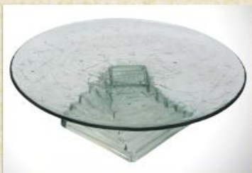
UD2506L Mod. decorado c/ ped. pirâmide Prato para bolo, pudim, tortas, doces, frios, assados e aperitivos 300mm (diam.) x 80mm (alt.)