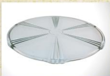
UD2675L Mod. Lion Prato para bolo, tortas, canapés, frios, aperitivos, carnes, tábua de vidro 320mm (diam.) x 12mm (alt.)