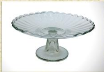
UD2520L Mod. canelada c/ pedestal longo Fruteira, centro de mesa, taça rasa p/ doces e aperitivos 205mm (diam.) x 92mm (alt.)