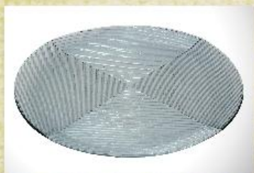
UD2657L Mod. Big Frisado Prato grande para bolo, tortas, canapés, frios, aperitivos, carnes e outros 390mm (diam.) x 10mm (alt.)