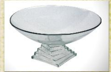
UD2342L Mod. TC c/ pedestal pirâmide Fruteira, saladeira, centro de mesa, tigela p/ doces, massas e gelatina 320mm (diam.) x 150mm (alt.)