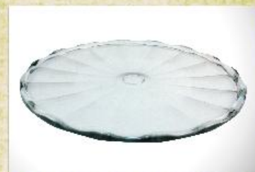
UD2663L Mod. Orion Prato para bolo, tortas, canapés, frios, aperitivos, carnes e outros 320mm (diam.) x 15mm (alt.)