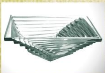
UD2555L Mod. Pirâmide Fruteira, saladeira, centro de mesa, tigela p/ doces 280mm (diam.) x 105mm (alt.)