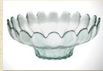
UD2032L Mod. Vanessa Fruteira, saladeira, centro de mesa, tigela p/ doces, massas e gelatina 225mm (diam.) x 70mm (alt.)