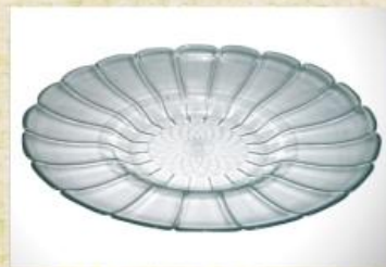
UD2662L Mod. Big Olga Fruteira, saladeira, travessa grande p/ frios, carnes e outros 390mm (diam.) x 85mm (alt.)