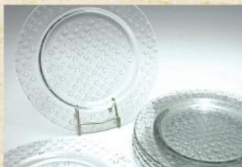
UD2251L Prato/Sousplat mod. decorado Descanso p/ pratos, tigelas e travessas, prato p/ pudim, frios e assados 310mm (diam.) Embalagem c/ 6 peças