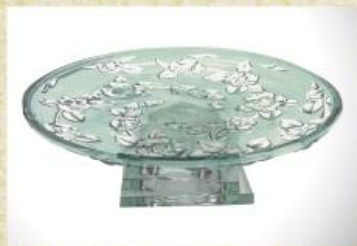
UD2566L Mod. Ibiza c/ pedestal pirâmide Fruteira, saladeira, centro de mesa, travessa p/ doces, frios e carnes 325mm (diam.) x 115mm (alt.)