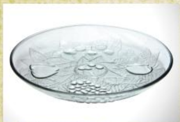
UD2030L Mod. decorado Prato para bolo, pudim, tortas, doces, frios, assados e aperitivos 309mm (diam.) x 29mm (alt.)