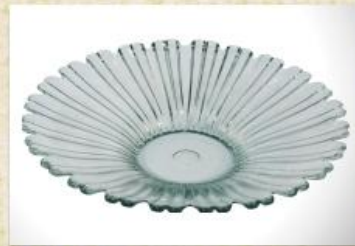
UD2562L Mod. Madri Fruteira, saladeira, centro de mesa 340mm (diam.) x 64mm (alt.)