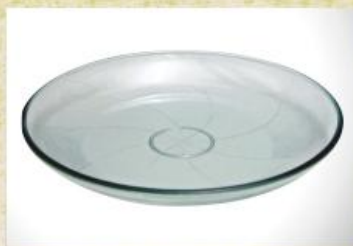
UD2007L Mod. Infinit Prato para bolo, pudim, tortas, doces, frios, assados e aperitivos 309mm (diam.) x 42mm (alt.)