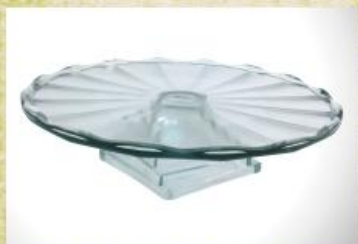
UD2671L Mod. Orion c/ pedestal pirâmide Prato para bolo, tortas, canapés, frios, aperitivos, carnes e outros 320mm (diam.) x 110mm (alt.)