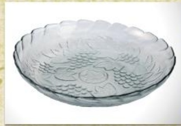
UD2512L Mod. Veneza Fruteira, saladeira, travessa p/ doces, aperitivos, carnes e outros 335mm (diam.) x 80mm (alt.)

Fruteiras, Saladeiras, Centros de mesa e Champanheiras